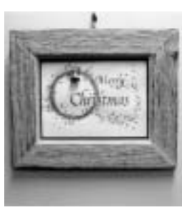
カリグラフィーの作品例

とき 11月10日(土)・11日(日) 11月17日(土)・18日(日) 11月24日(土)・25日(日) 12月2日(日)・9日(日)(各全2回) すべて同じ内容 。いずれも午後1時〜4時 対象 ウィンドウズ基本操作のできる小・中学生と保護者 内容 ワードを操作して写真やイラストなどを使いカレンダーを作ります