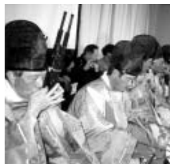
市民館まつりでの演奏