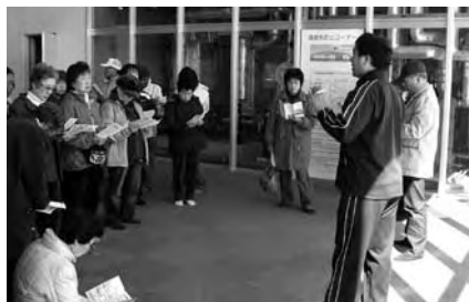
施設見学会のようす

60人(申込順) 参加料 :無料 持ち物 :帽子、水筒、筆記用具 申し込み :4月1日から美術博物館(☎51・2879)