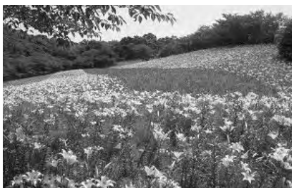
可睡ゆりの園に広がるゆり